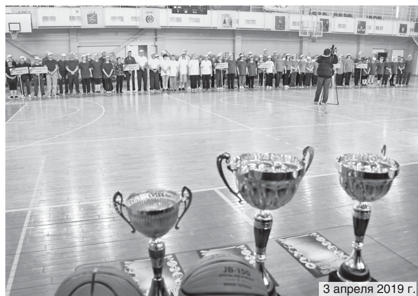
3 апреля 2019 г.