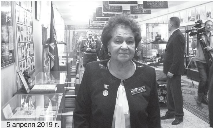
5 апреля 2019 г.