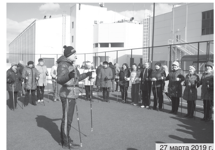
27 марта 2019 г.

Участники семинара станут инструкторами групп на местах.