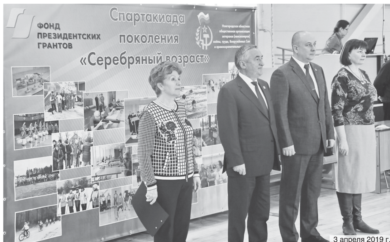
3 апреля 2019 г.

В апреле был осуществлен второй этап Спартакиады поколения «Серебряный возраст»: зональные соревнования прошли 3 апреля в Великом Новгороде, 10 апреля – в Старой Руссе и 17 апреля в Боровичах. В них приняли участие около трехсот человек.