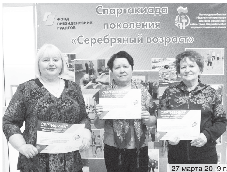
27 марта 2019 г.

Опорная сеть создается на базе отделов-центров по работе с населением в Великом Новгороде и советов ветеранов в районах Новгородской области. Здесь все желающие смогут узнать подробности проекта и записаться в группы для занятий этим доступным и безопасным видом активности.