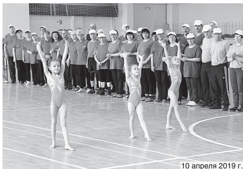
10 апреля 2019 г.